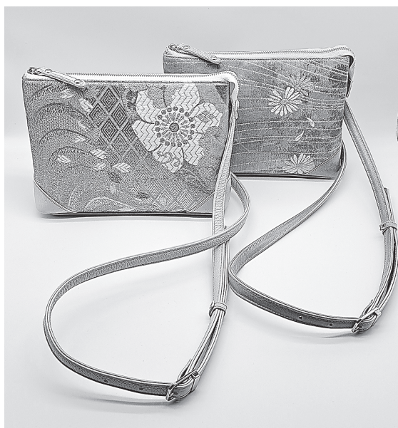
帯シヨルダーバッグ