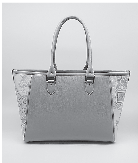
日本エコレザーで作ったバッグ

当時、私は普通の会社員として働いていましたが、若いころからやりたいことが見つかったら、それをやって行こうと決めています。そ